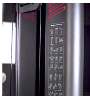
TABELLE MIT ÜBUNGEN

Verschiedene Griffhöhen für mehr Anpassungsfähigkeit für jeden Benutzer.